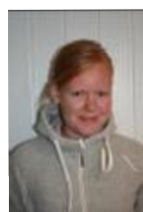
Assisterende styrer/ Styleder, Eier Barnehagelærer